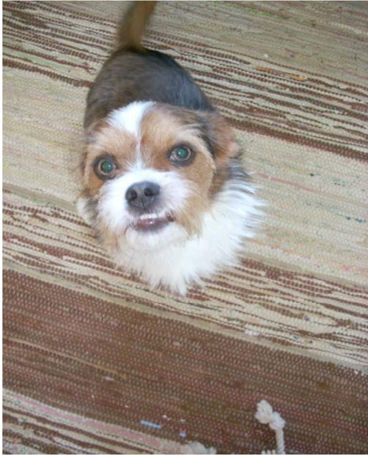
Pallo on Housen suosikki!